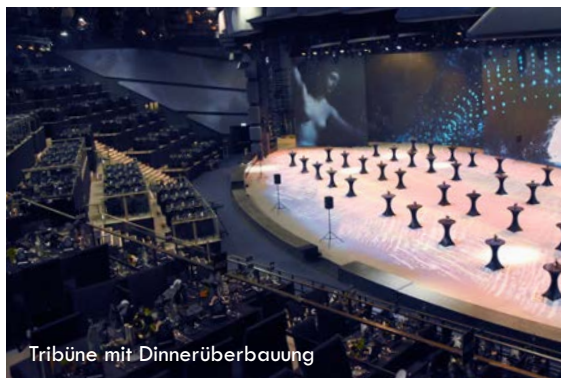
Tribüne mit Dinnerüberbauung

Der SHOWPALAST MÜNCHEN verfügt über einen Zuschauerraum für bis zu 1.700 Personen mit einer Bühnenfläche von über 1.200 Quadratmetern und der größten LED-Wand Europas mit fast 600 Quadratmetern. Zudem ist es möglich, weitere Räumlichkeiten unserer Meeting-Area exklusiv zu mieten.