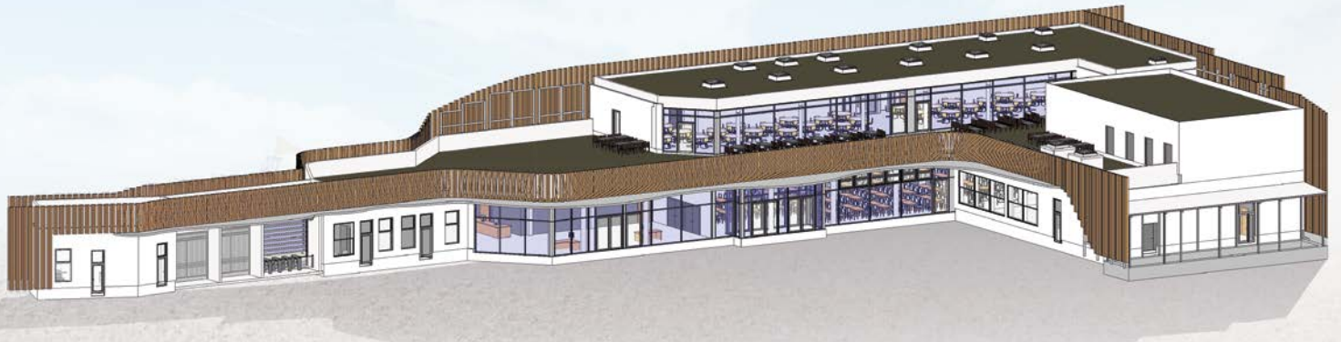
Außenansicht: Restaurant und Konferenzräume

Zu unserer Meeting-Area zählen unter anderem folgende Räumlichkeiten: