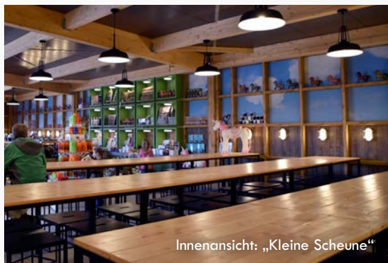
Innenansicht: „Kleine Scheune“