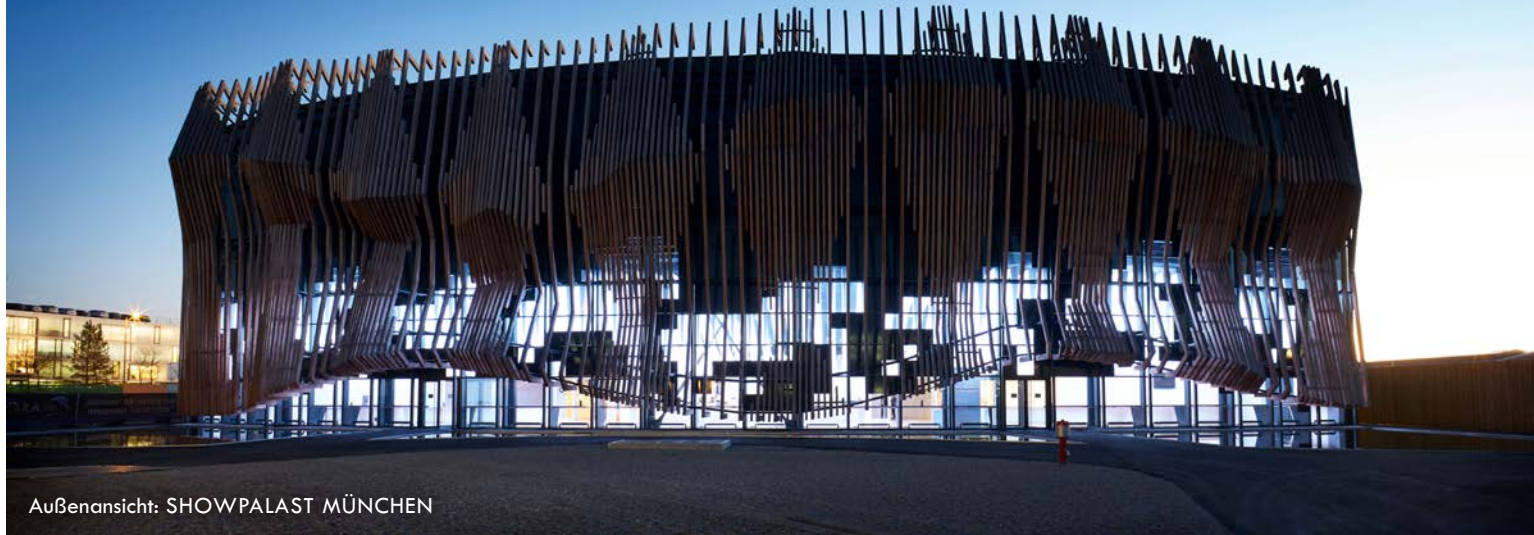
Außenansicht: SHOWPALAST MÜNCHEN