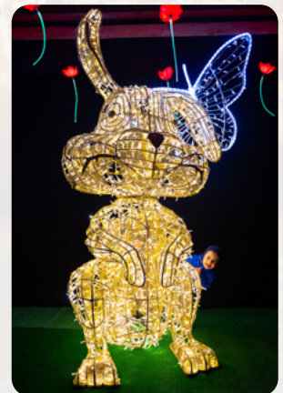
Ein niedliches Duo