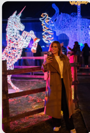
Schöne Momente einfangen