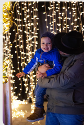
Momente voller Freude