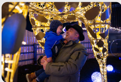
Spaß für Groß und Klein