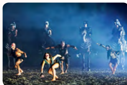
Equipe Fernandes als dunkles Volk