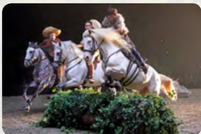
Trickreiter Sasá Importa im Sprung