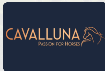
CAVALLUNA-Logo als PNG