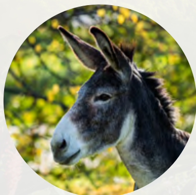
In der Show: Comedynummer – Francesco Nobile

Der Pura Raza Española (P.R.E.) stammt aus Spanien und gehört zu den ältesten Pferderassen in Europa. Die beliebten Vierbeiner sind eng mit den Berbern verwandt und wurden früher mit der Einkreuzung von Arabern und englischen Vollblütern veredelt. Sie verfügen über einen langen und reinen Stammbaum. Im Jahr 1912 wurden die spanischen Pferde dann in eine eigenständige Zuchtlinie abgetrennt, die bis heute streng reglementiert ist. Pferde mit vollwertigem Stammbaum werden als P.R.E. bezeichnet, ist die Zuchtlinie nicht klar nachvollziehbar, heißen sie Andalusier. Typisch für die schönen Warmblüter ist ihr intelligentes, energetisches und dennoch gehorsames Wesen. Südländisches Temperament trifft auf psychische Ausgeglichenheit – diese Kombination schätzen Reiter an ihnen besonders. Daher eignen sich die edlen Tiere perfekt für Lektionen der Hohen Schule, klassische Dressur und bieten die besten Voraussetzungen für die schwierige Kunst der Doma Vaquera. Bei CAVALLUNA zeigt sich die spanische Equipe um Sebastián Fernández mit ihren wunderschönen P.R.E.-Hengsten und beeindruckt das Publikum mit anspruchsvollen Lektionen.